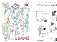
【②配布】一人一花ノベルティ