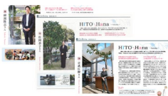
【①発信】一人一花連載企画