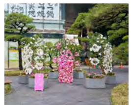
電気ビル共創館みらい広場