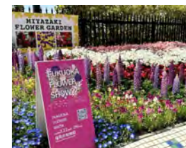
みずほPayPayドーム福岡