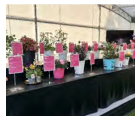
⑤FFSプランツアワード