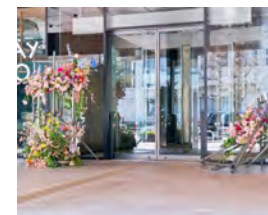
コネクトスクエア博多