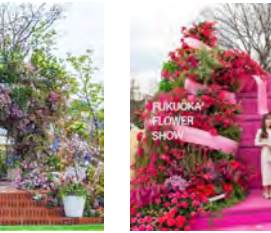
⑧メインフォトスポット