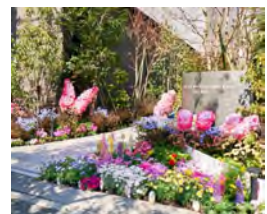
グランドメゾンギャラリー薬院