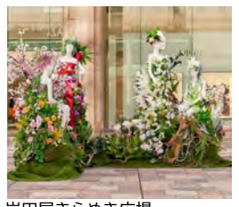
岩田屋きらめき広場