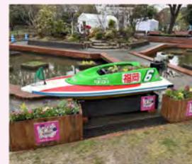
ボートレース福岡ブース (経済観光文化局)