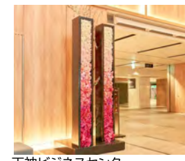
天神ビジネスセンター