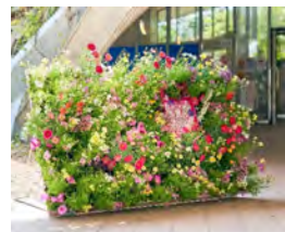
アイランドシティ中央公園