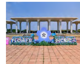
国営海の中道海浜公園