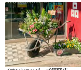
イオンショッピング福岡店