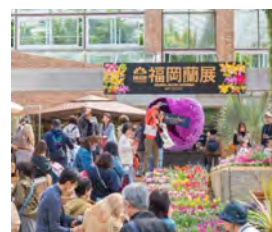
⑩温室企画(福岡蘭展2026)