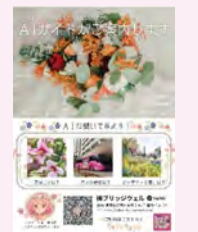
AIガイド案内 (経済観光文化局)