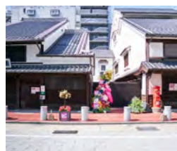
博多町家ふるさと館