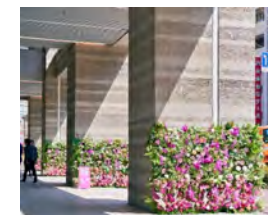
中央日土地博多駅前ビル