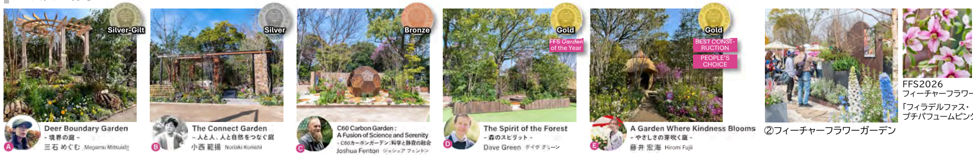
①国際水準のガーデンコンテスト