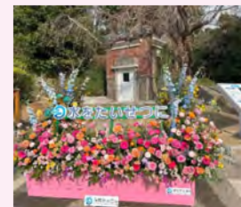
平尾浄水遺構花装飾(水道局)