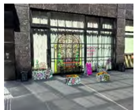
三井ガーデンホテル福岡祇園