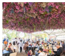
⑨飲食(レストラン内装飾)