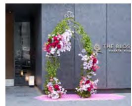
THE BLOSSOM HAKATA Premier