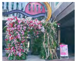
キャナルシティ博多