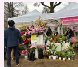
市内産花卉販売(農林水産局)