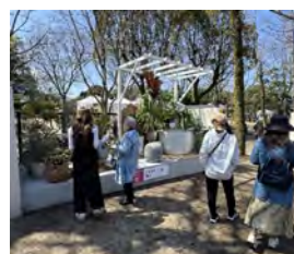
③ベランダガーデンコンテスト