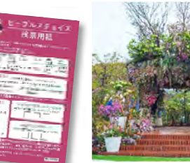
⑦シンボルガーデン