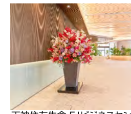
天神住友生命 FJビジネスセンター