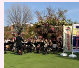
福岡市消防音楽隊(消防局)