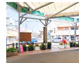
農産物直売店 ぶどう畑