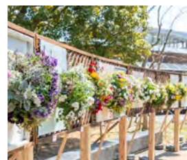
④ハンギングバスケットコンテスト