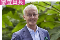
ジェームズ・アレクサンダー・シンクレア氏 (RHS副会長)