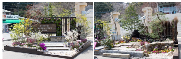
Fukuoka Flower Show 2026の様子