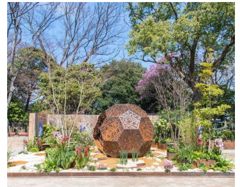
Fukuoka Flower Show 2026の様子