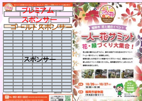
(イベント チラシ例)